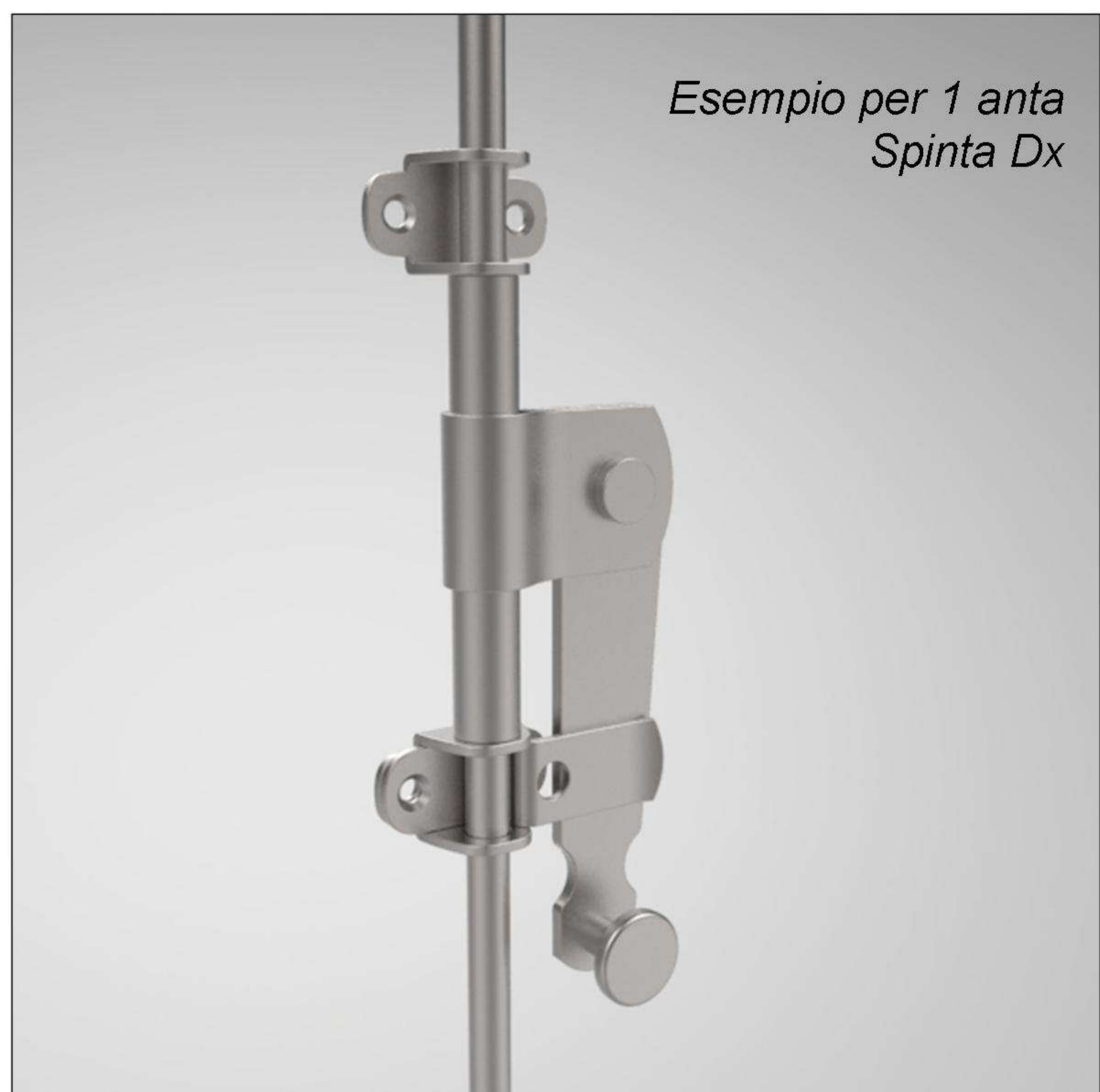
Esempio per 1 anta Spinta Dx